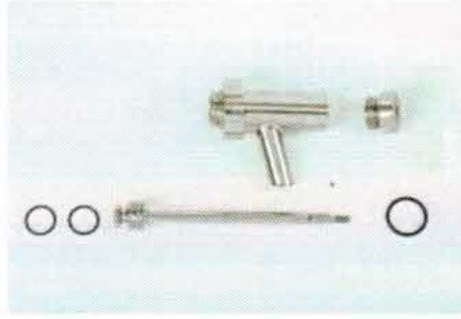
使用するパーツの数が少ないので、 取り外しや洗浄が簡単です。 機械の作動中も洗浄のために取り 外す事が可能です。